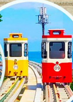
นั่งรถไฟปู๊กบีก

ราคานี้รวมค่าภาษีน้ำมัน + ค่าภาษีสนามบิน ** ปรับขึ้น ณ วันที่ 1 เม.ย. 69 เรียบร้อยแล้ว **