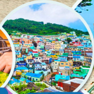
หมู่บ้านคัมซอน