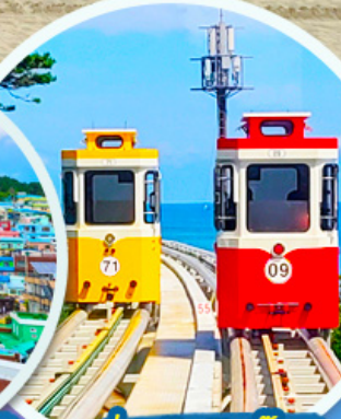
นั่งรถไฟปู๊กบีก

ราคานี้รวมค่าภาษีน้ำมัน + ค่าภาษีสนามบิน ** ปรับขึ้น ณ วันที่ 1 เม.ย. 69 เรียบร้อยแล้ว **