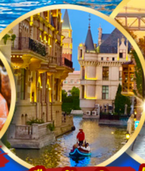
เมืองน้ำเวนิส