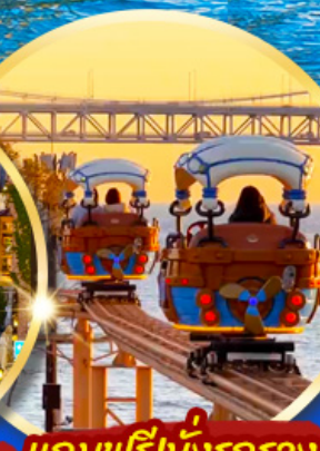
แถมฟรีนั่งรถราง