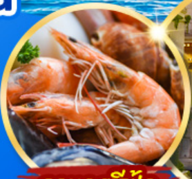
อาหารซีฟู้ด