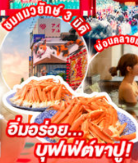
อิมมอร์รี่... บุฟเฟ่ต์จ๊าปู้!