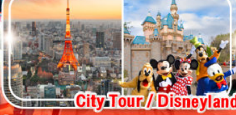
City Tour / Disneyland