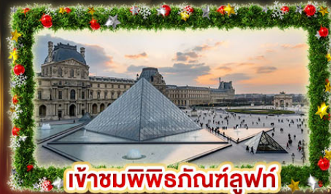
เข้าชมพีระมิดที่ลูฟร์