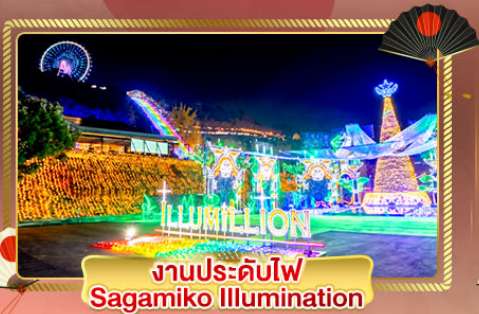
งานประดับไฟ Sagami Illumination