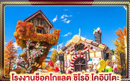
โรงงานช็อคโกแลต ชิโรอิ โคอิโตะ