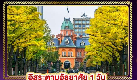
อิสระตามอัธยาศัย 1 วัน

น้ำหนักกระเป๋า 20 Kg. บริกอาหาร บนเครื่อง ไป-กลับ