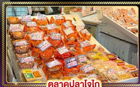
ตลาดปลาโอไก