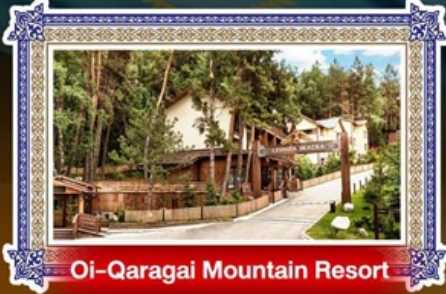
Oi-Qaragai Mountain Resort