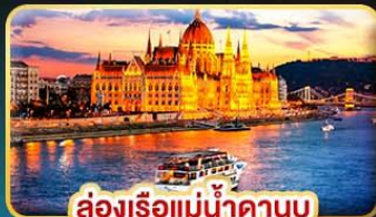
ส่องเรือแม่น้ำดาบুব ช่วง Twilight