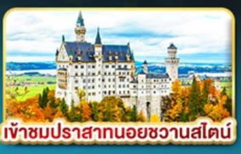
เข้าชมปราสาทนอยชวานสไตน์

คัดสรรความเป็น "ที่สุด" ของยุโรปตะวันออกครบถ้วน