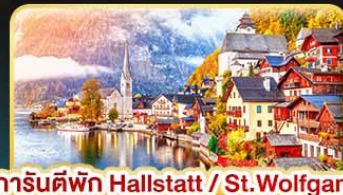
การ์นต์พัก Hallstatt / St. Wolfgang หรือริมทะเลสาบ 1 คืน