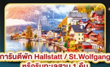
การันตีพัก Hallstatt / St. Wolfgang หรือริมนทะเลสาบ 1 คืน