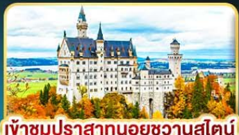
เข้าชมปราสาทนอยชวานสไตน์

คัดสรรความเป็น "ที่สุด" ของยุโรปตะวันออกครบถ้วน