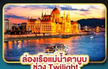
ส่องเรือแม่น้ำดานูบ ช่วง Twilight