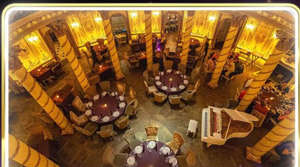
ทานอาหารสุดหรู ภัตตาคารTurandot