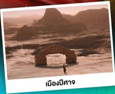
เมืองปีศาจ