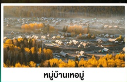
หมู่บ้านหอยมู