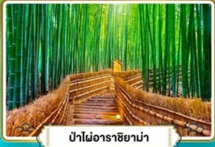
ป่าไฟอาราชิยาม่า