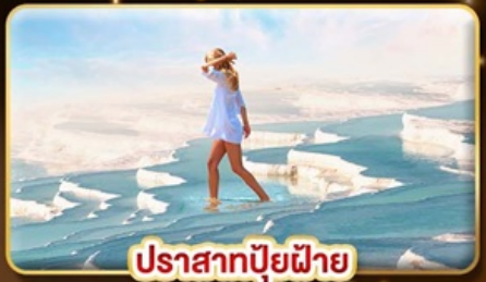
ปราสาทบูยีผาย