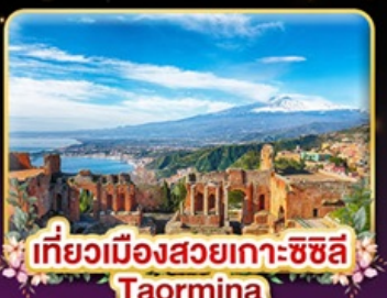
เที่ยวเมืองสวยเกาะซซิลี Taormina