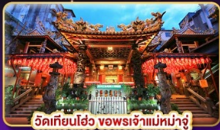
วัดเทียนฮั่ว ของพระเจ้าแม่หม่าจู