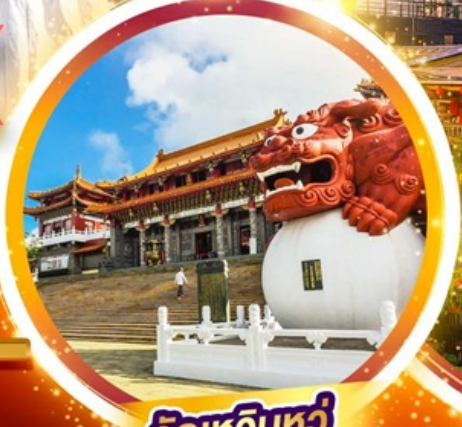
วัดหัวหน่วง