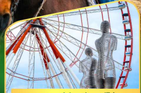
อนุสาวรีย์อาลีและนีโน่