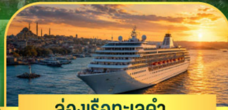
ล่องเรือทะเลดำ