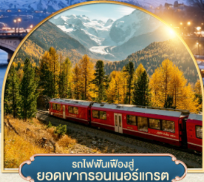
รถไฟฟันเฟืองสู่อยอดเขากรอนเนอริเกรต