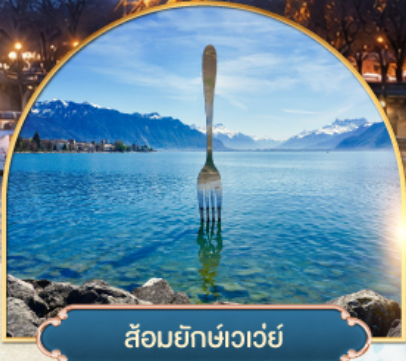
ล้อมยักซ์เวเวย์