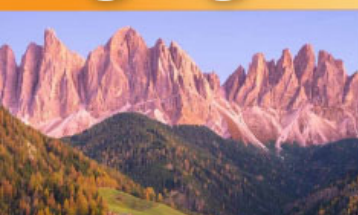
อุทยานแห่งชาติโดโลไมท์