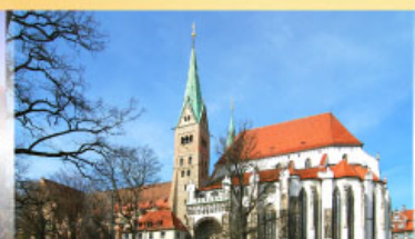
มหาวิหารเอาค์สเวิร์ค