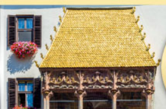
หลังคาทองคำอินน์สบูร์ค