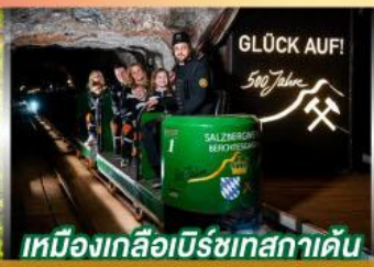
เหมืองเกลือเบิร์ชเทสกาเดิน