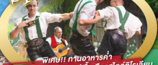
พิเศษ!! ทานอาหารค่ำ พร้อมชมการแสดงดนตรีพื้นเมืองสไตส์ทีโรเลียน และเยือนเมืองอูเทรคต์ สีสันใหม่เนเธอร์แลนด์

ไฮไลท์ในโปรแกรม • เยือนเมืองแห่งแคว้นบาวาเรีย และ ติโรล • สุกสนานเหมืองเกลือเบิร์ชเทสกาเดิน • เข้าชมปราสาทนอยชวานสไตน์ • เดินเล่นจัตุรัสโรเมอร์ ซอปปิง Zeil Street • ถ่ายรูปมุมสวยของหมู่บ้านอัลสติก • ซิลลา ไปในเมืองซาลสบูร์ก บ้านเกิดโมซาร์ท • ล่องเรือหมู่บ้านทีธูร์น และ ล่องเรือชมนครอัมสเตอร์ดัม • ซอปปิงจุใจย่านดิมสแควร์และเดินเล่นย่านโคมแดง 25 ก.ย. - 04 ต.ค. 69 09-18, 16-25 ต.ค. 69 22-31 ต.ค. 69 / 06-15 พ.ย. 69 29 ธ.ค. 69 - 07 ม.ค. 70 * ปีใหม่ *