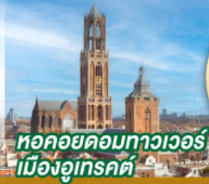
หอคอยคอกทาวเวอร์ เมืองอูเทรคต์