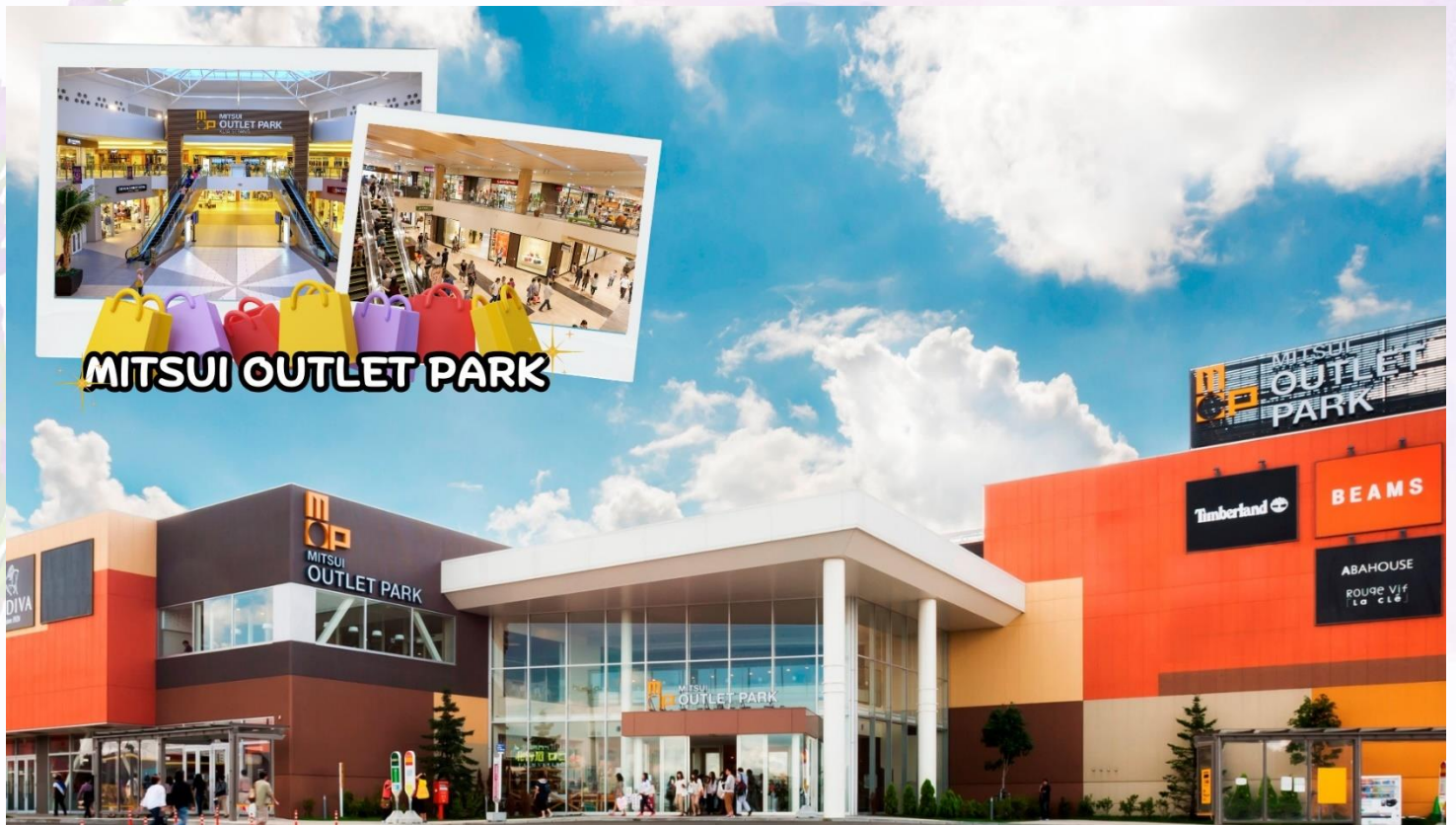
กลางวัน อีตระอาหารกลางวันตามอัยาศัย ณ MITSUI OUTLET PARK SAPPORO