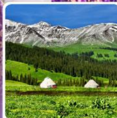
ทุ่งหญ้านาลาติ