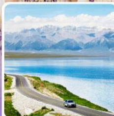
ทะเลสาบไซไห่หลี่มู่