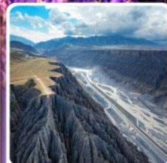
แกรนด์แคนยอนคู่ชานจื่อ