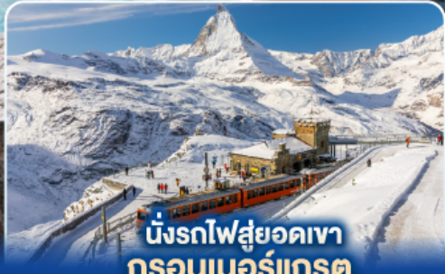
นั่งรถไฟสู่ยอดเขา กรอนเนอร์แกรต