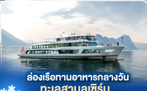
ล่องเรือทานอาหารกลางวัน ทะเลสาบลูซิิร์น