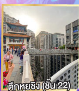
ตึกหุ่ยซิง (ชั้น 22)