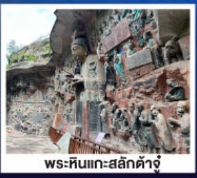
พระหินแกะสลักตัวจู้