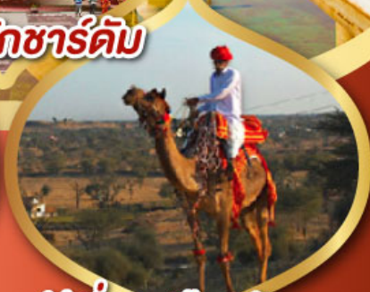
ฟรี ขี่อูฐ เมืองมันทวา ราคาเริ่มต้น