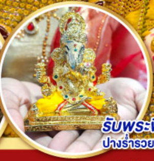
รับพระพิฆเนศวร ปางรำรอย ท่านละ 1 องค์