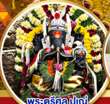
พระตรีศูล ปูเน่ (Trishul Pune)