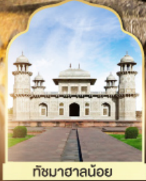
ถ้ำอาชานน้อย