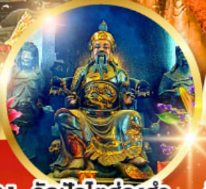
วัดปักโต้อ่องอำ