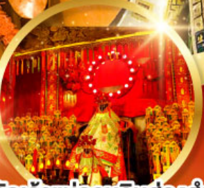
วัดเจ้าแม่กวนอิมอ่องอำ (สวนหนานเท่ลี่ยน)