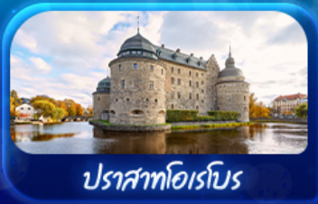
ปราสาทโฮเรโบร

รหัสโปรแกรม : SEK168 9วัน 6คืน เจ้าสวดีออกโฮล์ม-ออกโคเปนเฮเกน