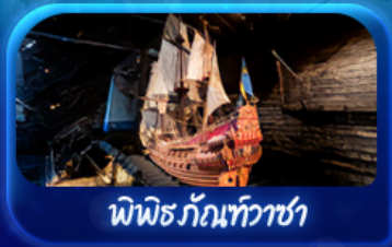
พิพิธภัณฑ์ทิวาชา