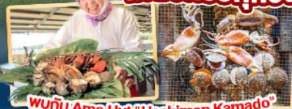
พบกับ Ama Hut "Haohiman Kamado" เมนูพิเศษ SEA FOOD

✈️ สายการบิน AirAsia X (XJ) น้ำหนักกระเป๋า 20 KG