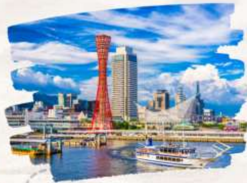
โทเบฮาร์เบอร์แลนด์

ทริปเที่ยวเที่ยวครบ ธรรมชาติ ศาลเจ้า ปราสาท และออนเซ็น