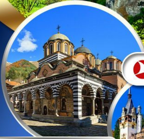
ชม "อารามมรดกโลกริลา"