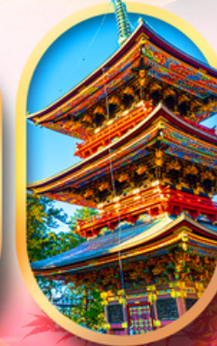
วัดนาริตะชิน