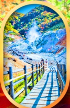
หุบเขานรกจิกุคุดามิ