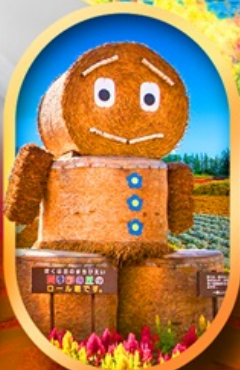
ซิกิโซ โนะโอะกะ