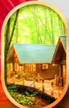
นิงเกิ้ลทอรัส