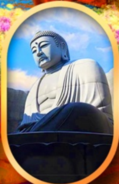
เบ็นเนาแห่งพระพุทธรเจ้า