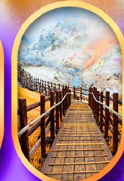
จิกุคคาบิ