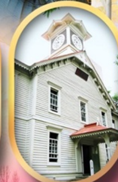
ผ่านชมหอนาฬิกา