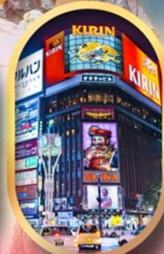
ช้อปปิ้งย่านซูซุกิโนะ