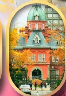
ศาลาว่าการเก่า