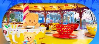
Fuji q Highland x Butterbear เดินทาง พ.ศ. 69 เป็นต้นไป