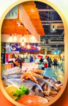
ตลาดปลาฮิองโก