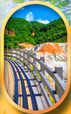
โนโบริเบทสึ