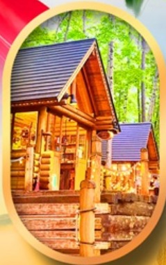
นิงเกิ้ลเกอเรส