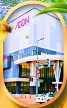
อ็อนมอลล์