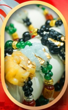
ร้านหยกอัญมณี