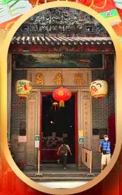
เจ้าแม่กวนอิมสองอ่า