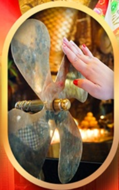
หมอนกั้งหันแซง