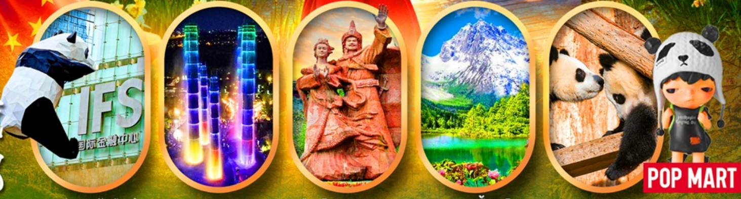
IFS หมีแพนด้าป็นตึก SKP Global Center เมืองโบราณซงพาน อุทยานปี้เฉิงโกว ศูนย์อนุรักษ์หมีแพนด้า

เจิงตู ปี้เฉิงโกว จิ้งจ้ายโกว หมีแพนด้าตัวเป็นๆ