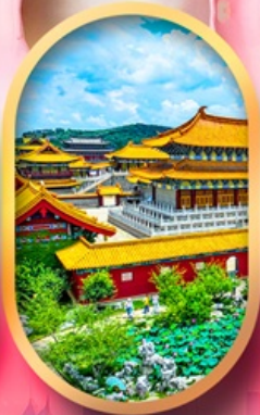
เมืองจำลองสามก๊ก