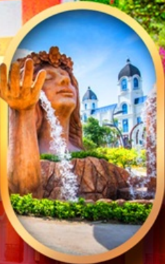
น้ำตกเทพพิสดวง