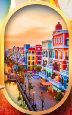
เวนิสแห่งเวียดนาม