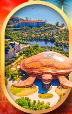
พิพิธภัณฑ์สัตว์น้ำ