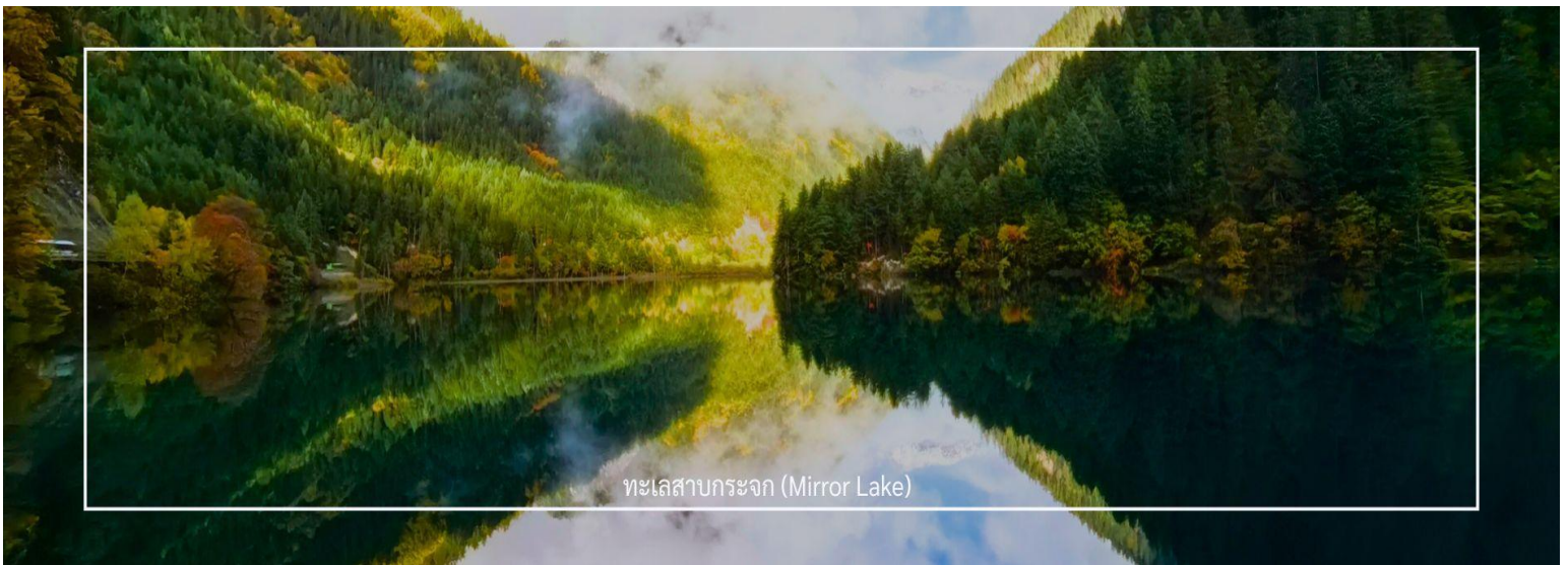
ทะเลสาบกระจก (Mirror Lake)

ทะเลสาบกระจก หรือ Mirror Lake ตั้งอยู่ในอุทยานแห่งชาติจิวจ้ายโกว เป็นทะเลสาบที่ได้รับความนิยมในการถ่ายรูปมากที่สุดแห่งหนึ่ง เนื่องจากทะเลสาบแห่งนี้มีความกว้างมาก จึงสามารถสะท้อนภาพภูเขาและท้องฟ้าได้อย่างสวยงามราวกับกระจก ทะเลสาบกระจกมีความลึก 32 เมตร น้ำในทะเลสาบใสเป็นสีเขียว สามารถมองเห็นพื้นทะเลสาบได้