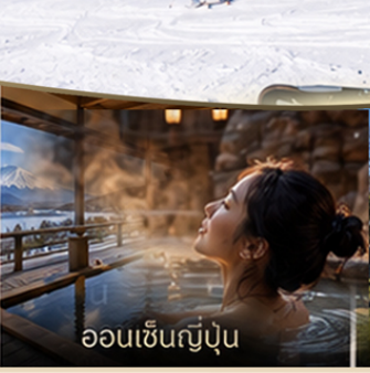
ออนเซ็นญี่ปุ่น