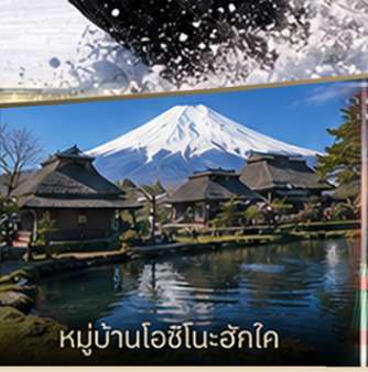
หมู่บ้านโอชิโนะอ๊กโค