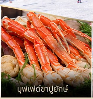
บุฟเฟต์ซาปูยักซ์