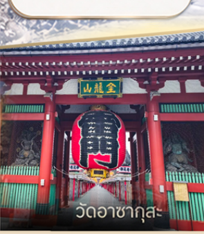
วัดอาสาซุกุสะ