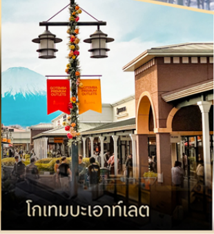
โกเกมมะเอาก์เล็ท