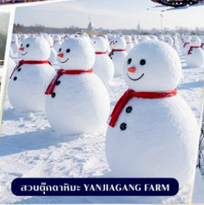
สวนฤดูหนาว Yanjiagang Farm