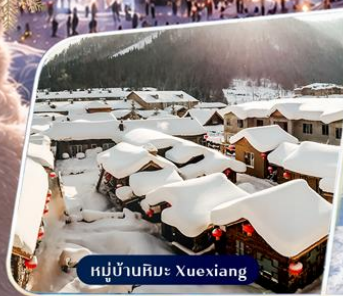
หมู่บ้านหิมะ Xuexiang