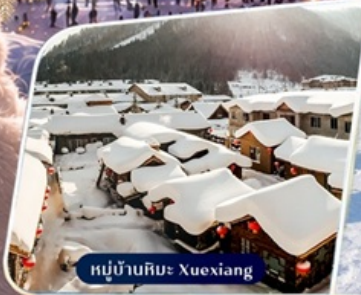
หมู่บ้านหิมะ Xuexiang