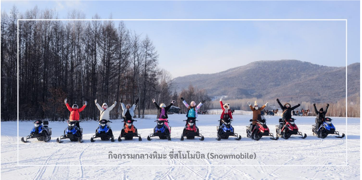
กิจกรรมกลางหิมะ ซีสนโม่บิล (Snowmobile)

สมควรแก่เวลานำท่านเดินทางสู่เมือง มู่ตันเจียง (Mudanjiang) ใช้เวลาเดินทางประมาณ 2 ชั่วโมง มู่ตันเจียง เมืองสำคัญตั้งอยู่ใกล้พรมแดนรัสเซีย ห่างไปทางตะวันตกประมาณ 110 กิโลเมตร เมืองนี้มีเอกลักษณ์วัฒนธรรม และสถาปัตยกรรมที่ผสมผสานระหว่างรัสเซียและจีน โดยเฉพาะในฤดูหนาวเมืองจะถูกปกคลุมด้วยหิมะขาวโพลน