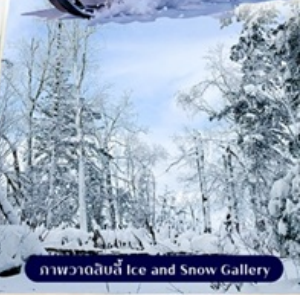
ภาพวาดด้วยน้ำแข็ง Ice and Snow Gallery