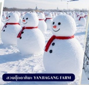
สวนตุ๊กตาหิมะ YANJIANG FARM