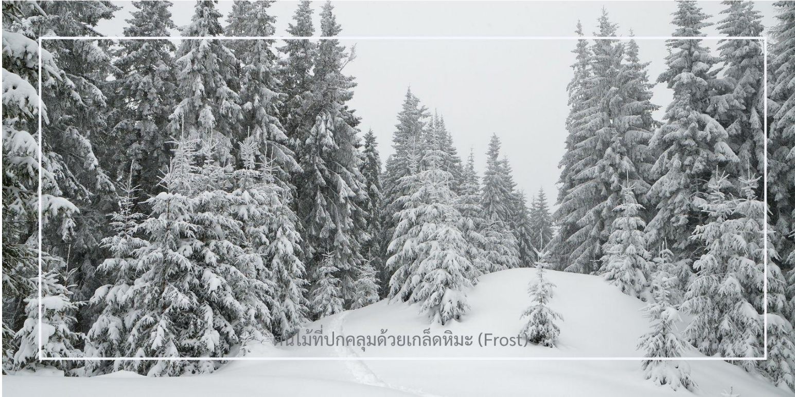
ต้นไม้ที่ปกคลุมด้วยเกล็ดหิมะ (Frost)

ยาบูลี (Yabuli) เมืองตากอากาศชื่อดังทางตอนเหนือของจีน ตลอดเส้นทาง ท่านจะได้เพลิดเพลินกับทัศนียภาพของฤดูหนาวที่งดงาม รวากับฉากในนิยาย ท่ามกลางต้นไม้ที่ปกคลุมด้วยเกล็ดหิมะ (Frost) ระเบียบระย้าบราวคริสตัล สองข้างทาง แต่งแต้มไปด้วยหิมะขาวนวล เป็นบรรยากาศที่หาได้ยากและงดงามจับใจในแบบเฉพาะของดินแดนภาคตะวันออกเฉียงเหนือของจีน