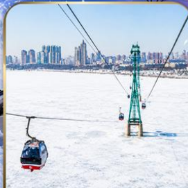
นั่งกระเช้าไฟฟ้า HARBIN ROPEWAY