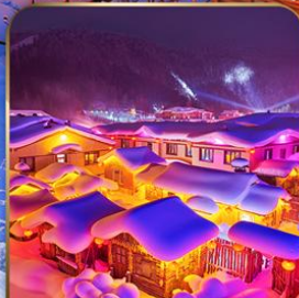
หมู่บ้าน DREAM HOME