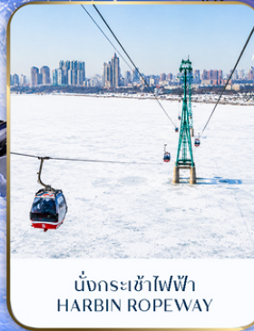
นั่งกระเช้าไฟฟ้า HARBIN ROPEWAY