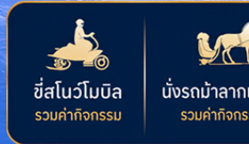
ขี่สโนว์โมบิล รวมค่ากิจกรรม