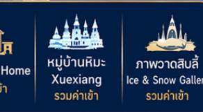
คฤหาสน์วอลการ์ รวมค่าเช่า