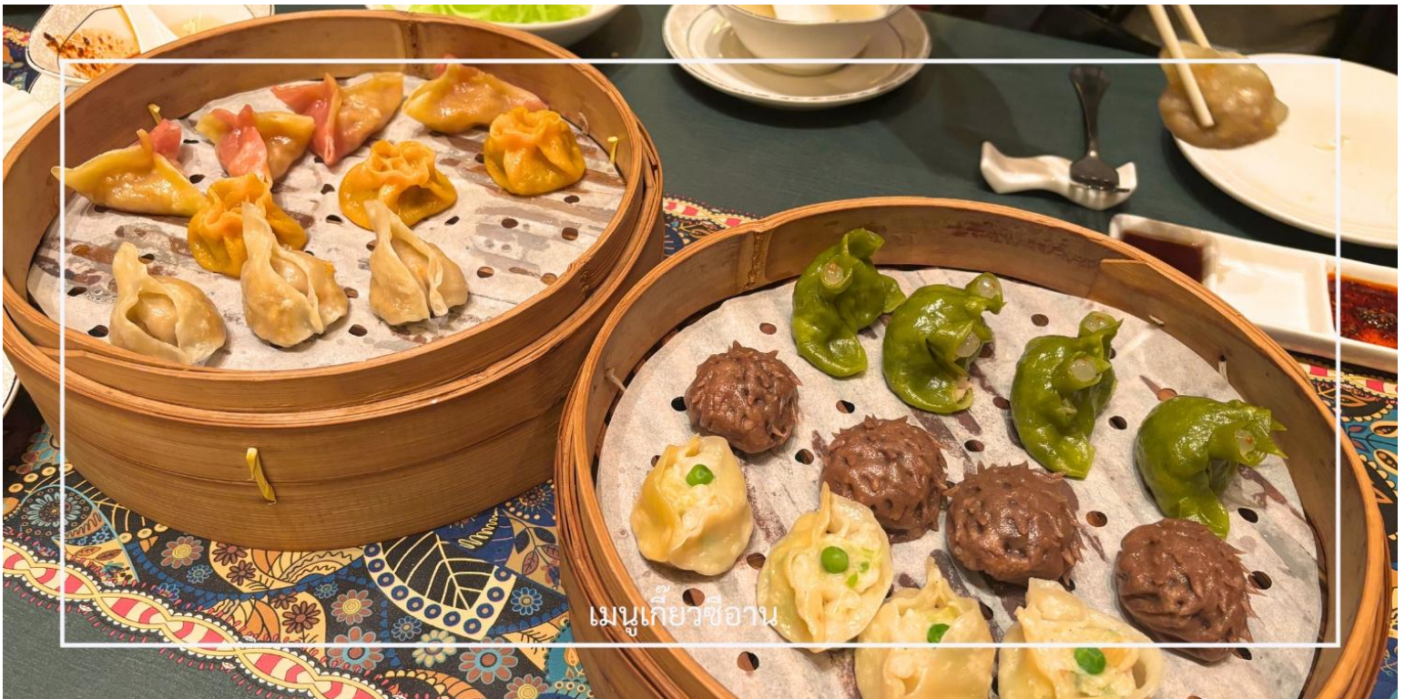
เมนูเกี้ยวซีอาน

พร้อมทั้งลิ้มรสเกี้ยวซีอาน อาหารท้องถิ่นชื่อดัง รสชาติจัดจ้านกลมกล่อม ซึ่งเป็นประสบการณ์ทางวัฒนธรรมและรสชาติที่ควรลิ้มลองสักครั้ง