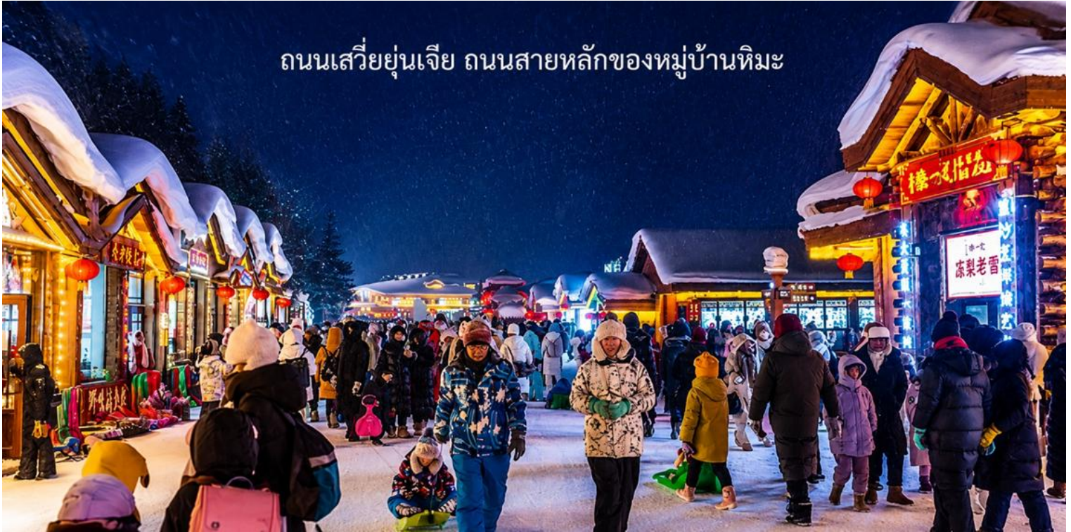
ถนนเสวี่ยยุ่นเจีย ถนนสายหลักของหมู่บ้านหิมะ

นำท่านเดินชมบรรยากาศบน ถนนเสวี่ยยุ่นเจีย ถนนสายหลักของหมู่บ้านหิมะ ที่ได้เต็มไปด้วยร้านค้าของที่ระลึก ร้านอาหารท้องถิ่น และร้านกาแฟน่ารัก ๆ ถนนสายนี้ถูกตกแต่งด้วยไฟประดับและโคมแดงสไตล์จีน เพิ่มเสน่ห์ให้บรรยากาศอบอุ่น และมีชีวิตชีวาที่ท่านสามารถช้อปปิ้งสินค้าท้องถิ่น หรือสินค้าแฮนด์เมด พร้อมถ่ายภาพเก็บความทรงจำในมุมสวย ๆ ของหมู่บ้าน ได้ตลอดทั้งคืน