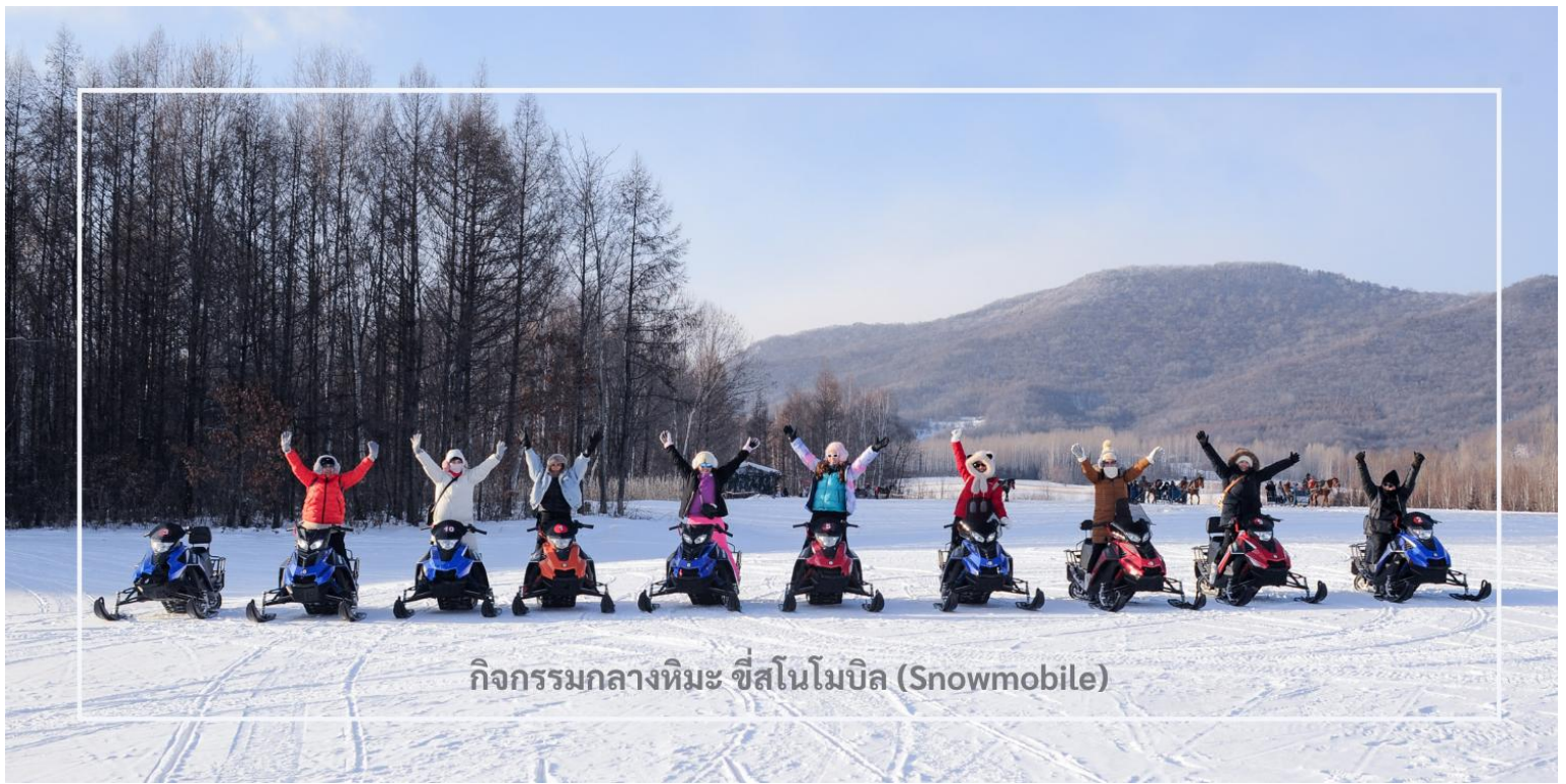
กิจกรรมกลางหิมะ ซีสนโมบิล (Snowmobile)

สมควรแก่เวลานำท่านเดินทางสู่เมือง มู่ตันเจียง (Mudanjiang) ใช้เวลาเดินทางประมาณ 2 ชั่วโมง มู่ตันเจียง เมืองสำคัญตั้งอยู่ใกล้พรมแดนรัสเซีย ห่างไปทางตะวันตกประมาณ 110 กิโลเมตร เมืองนี้มีเอกลักษณ์วัฒนธรรม และสถาปัตยกรรมที่ผสมผสานระหว่างรัสเซียและจีน โดยเฉพาะในฤดูหนาวเมืองจะถูกปกคลุมด้วยหิมะขาวโพลน