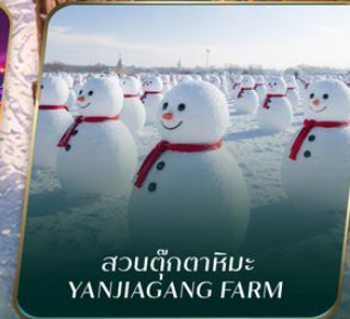
สวนตุ๊กตาหิมะ YANJIAGANG FARM