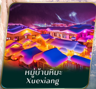
หมู่บ้านหิมะ Xuexiang