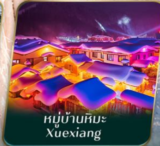
หมู่บ้านหิมะ Xuexiang