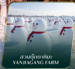
สวนตุ๊กตาหิมะ YANJIAGANG FARM