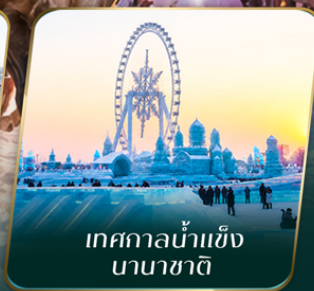
เทศกาลน้ำแข็ง นานาชาติ