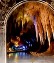
ดำโพรมึรือส BOAT RIDE

เดินทางช่วงปีใหม่ 27 ธ.ค. - 3 ม.ค. 70 ราคาเพียง 75,989 บาท / ท่าน