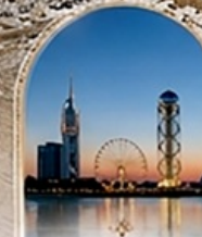
บาทุมึ BLACK SEA BOULEVARD