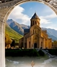
มัทสเคต้า UNESCO HERITAGE